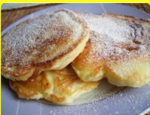
PLACKI Z JABŁKAMI