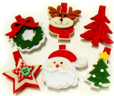
OZDOBY NA CHOINKĘ