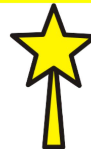
GWIAZDA NA CHOINKĘ