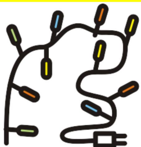
ŚWIATEŁKA NA CHOINKĘ